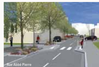
Dans le centre-ville, la circulation sera plus apaisée.