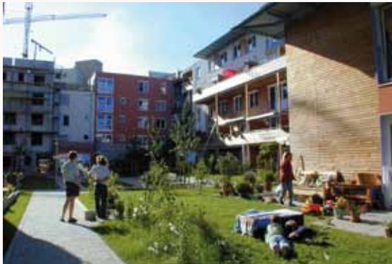
Exemple d'îlot paysager

Le centre-ville sera constitué de nombreux îlots paysagers. Ces "jardins habités" vont donner au cœur de ville une ambiance agréable et une vision aérée où il fera bon vivre.