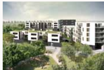
ZAC Andromède, Toulouse