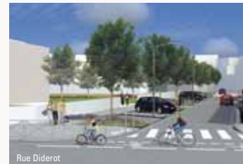
Une large place va être donnée aux modes doux.

L'objectif du réaménagement est de conforter la dimension commerciale de la place (marché, vitrine commerciale de la rue Henri-Maréchal). Les déplacements et le stationnement seront repensés afin de fluidifier la circulation. Des espaces de détente agrémenteront ce lieu pour lui donner un caractère plus convivial. A l'issue des travaux, la place deviendra une entrée de ville accueillante en articulation avec la gare et le centre-ville.