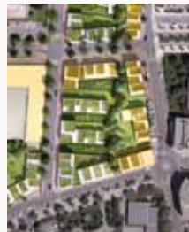
Disposition d'un îlot ouvert

Le cœur de Saint-Priest s'organisera autour d'îlots ouverts avec des bâtiments alignés sur la rue et d'autres perpendiculaires à la voie. Cette disposition favorisera les percées visuelles.