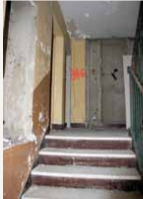
Les premières phases des travaux consistent à mettre à nu et désamianter l'intérieur des bâtiments.

La dernière page de l'histoire des barres A et B des Alpes s'écrit derrière de longues palissades blanches. Construits dans les années 60, les deux bâtiments de huit étages (198 logements en tout) ont accueilli des générations de San-Priots. C'est deux ans après le relogement des derniers habitants que les Alpes se préparent à toucher terre, pour laisser place à un centre-ville modernisé. Mais pas de démolition spectaculaire pour ces grandes dames qui seront « grignotées » en douceur.